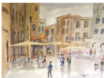
Piazza animata / Navdušenje na trgu / Animated square, 2015, 46 x 61 cm