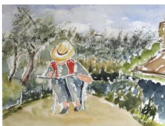
L'artista in giardino / Umetnik na vrtu / Artist in the garden, 2016, 46 x 61 cm