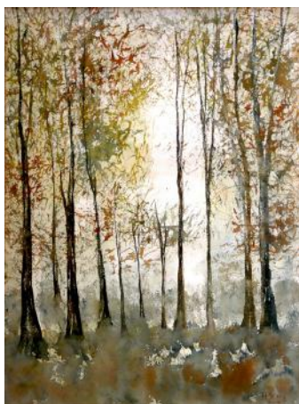
Bosco / Gozd / Woods, 2016, 61 x 46 cm

Circa 130 anni separano i due pittori che sono l'espressione di due epoche diverse e perciò portatori di visioni diverse. Ardito e velleitario può quindi apparire l'accostamento. Tuttavia, a prescindere dall'approccio storico e tecnico, è possibile individuare punti comuni delle rispettive sensibilità ripensando ad alcune predilezioni ben note di Cesare Dell'Acqua. Ed è così che fra le varie opere esposte da François Piers figurano alcune che si allacciano a temi cari all'artista piranese trattati in chiave moderna, come gli affetti famigliari, l'esotismo/orientalismo, la passione per Venezia, l'amore degli animali, non disgiunti da un certo umorismo. Dell'Acqua era anche un amatore del Mare