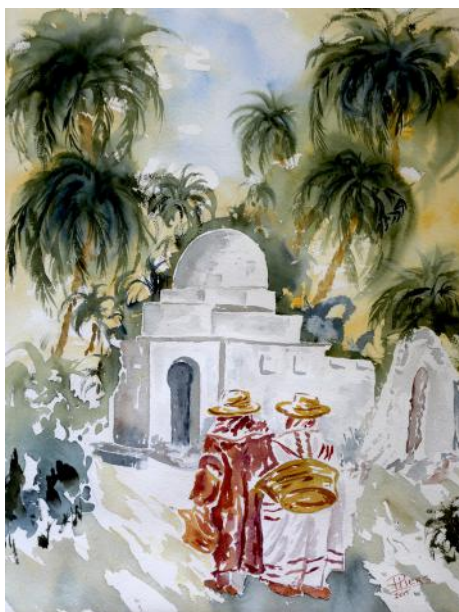
Donne di Gerba a Tozeur / Ženske iz Djerbe v Tozeurju / Djerba women in Tozeur, 2015, 61 x 46 cm