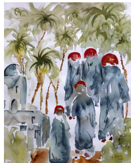
Capriccio esotico / Eksotični capriccio / Exotic capriccio, 2017, 46 x 61 cm