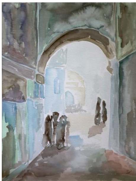
Nella medina / V Medini / In the medina, 2014, 40 x 30 cm