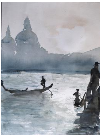
Scende la sera / Večeri se / Evening falls, 2018, 61 x 46 cm