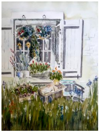
Davanzale fiorito / Cvetoča okenska polica / Flowerly windowsill, 2015, 61 x 46 cm

del Nord e soggiornava regolarmente alla costa belga durante le vacanze estive contabilizzando addirittura le nuotate nei suoi taccuini di schizzi e note.