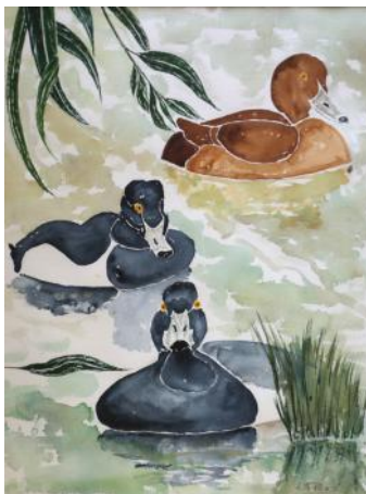
A riposo sull'acqua / Počitek na vodi / At rest on the water, 2020, 61 x 46 cm

Setting up an exhibition of watercolours in Piran can be a good opportunity to address a deferential thought to the artist who was born there and achieved levels of excellence in this difficult technique: Cesare Dell'Acqua (1821- Brussels 1905). The internationally renowned painter was also a co-founder of the prestigious Société belge des aquarellistes which attracted many artists from various European countries.