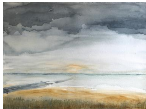
Calma autunnale al Mare del Nord / Jesensko zatišje ob Severnem morju / Autumn calm at the North Sea, 2015, 57 x 76 cm