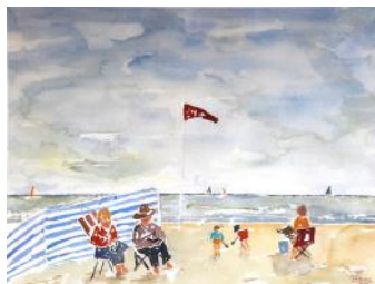
Piaceri di spiaggia / Užitki na plaži / Beach pleasures, 2017, 46 x 61 cm

Sprva zelo skeptičen in nenaklonjen takšni izkušnji, je François Piers po poučnem obisku nedavno prenovljenega Muzeja lepih umetnosti v Antwerpnu, ki je v nekaterih prostorih prevzel novo formulo razstave s kombinacijo starodavnih in sodobnih del, končno sprejel izziv,