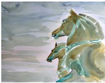
I cavalli di San Marco / Konji Svetega Marka / The horses of San Marco, 2018, 46 x 61 cm

And it is precisely a Belgian watercolourist, François Piers, who has been invited to present his works by virtually recalling the figure of Cesare Dell'Acqua with some of them, and moreover submitting himself to a particularly demanding exhibition formula almost dotting various rooms of a museum, the birthplace of the famous violinist-composer Giuseppe Tartini.