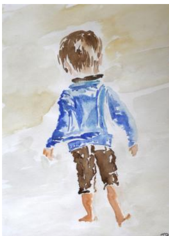
Jean, 2014, 40 x 30 cm