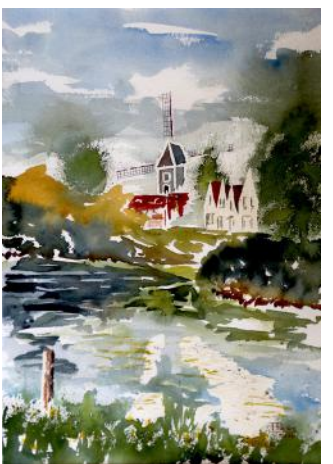
Molino a vento / Mlin na veter / Windmill, 2017, 61 x 36 cm