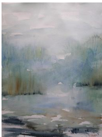
Riflessi allo stagno / Razmišljanja ob ribniku / Reflections at the pond, 2021, 61 x 46 cm