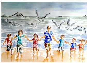
Gioia in famiglia / Družinsko veselje / Joy in the family, 2014, 36 x 51 cm