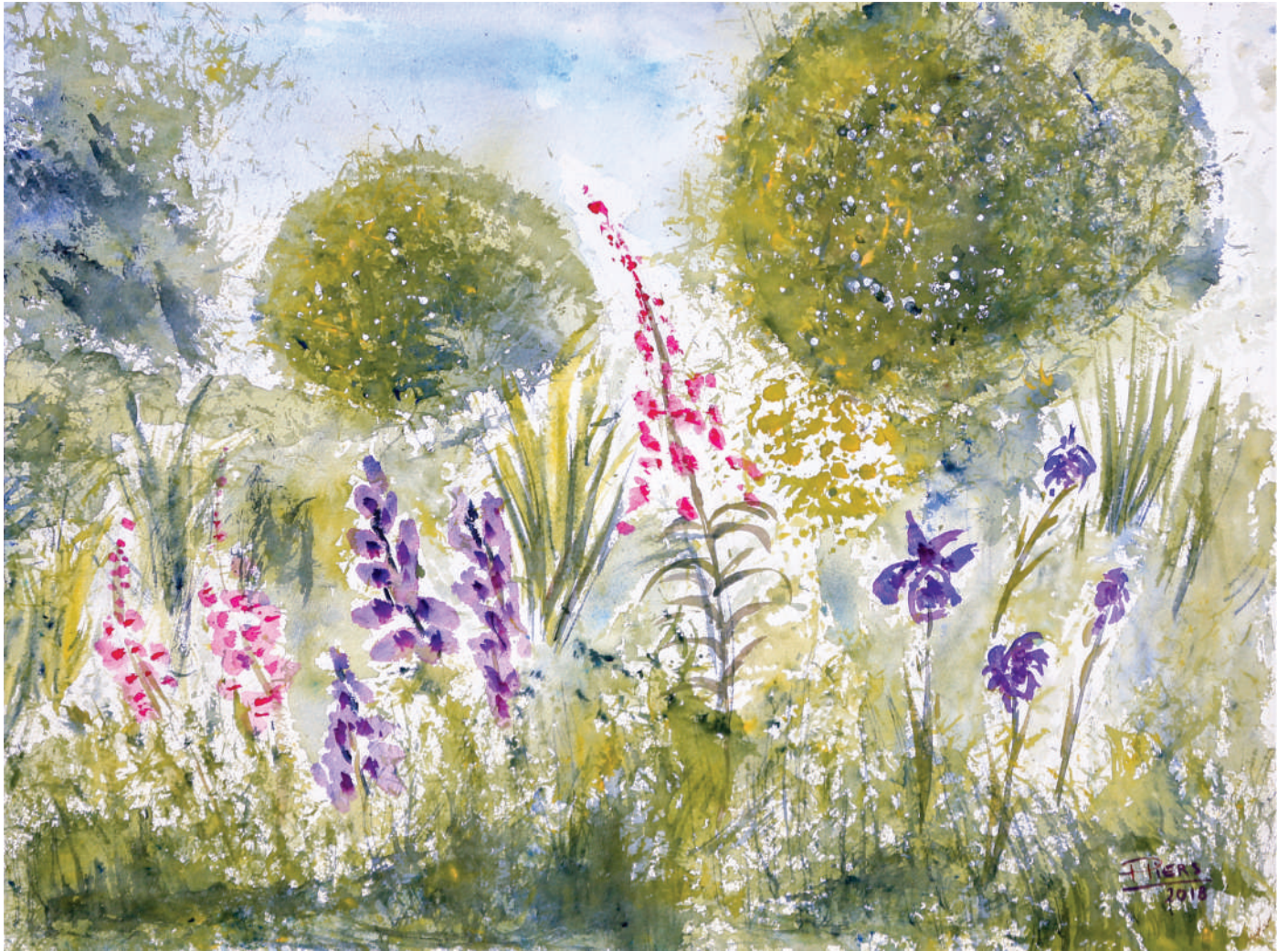
Jardin à Retranchement / Garden at Retranchement, 2018, aquarelle/watercolour, 46x61 cm