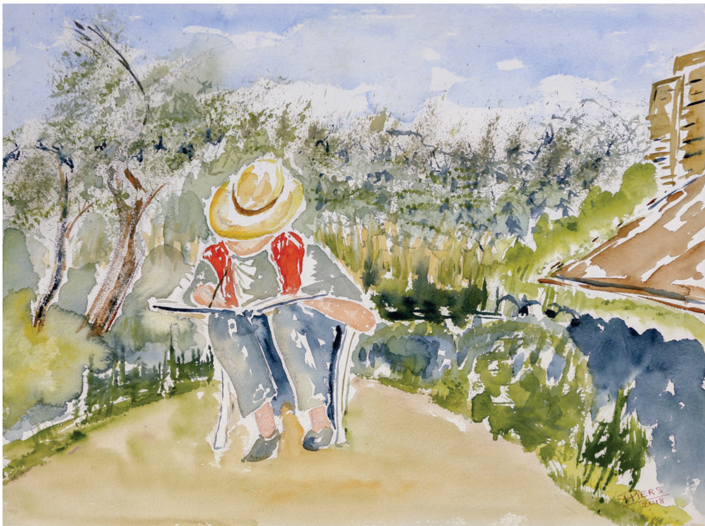
L'artiste au jardin / Artist in the garden, 2016, aquarelle/watercolour, 46x61 cm