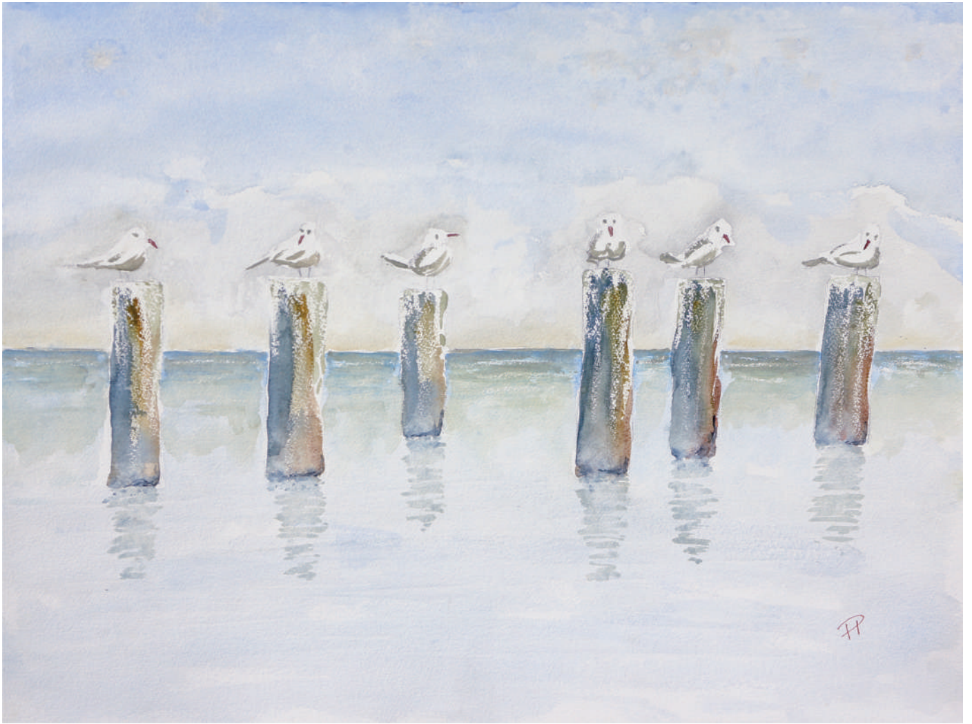
Gammarth, (2016), aquarelle/watercolour, 46x61 cm