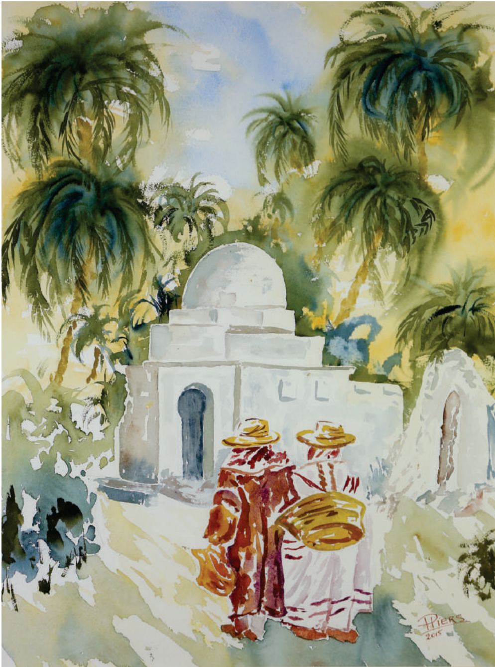
Djerbiennes à Tozeur/ Djerba women in Tozeur, 2015, aquarelle/watercolor, 61x46 cm