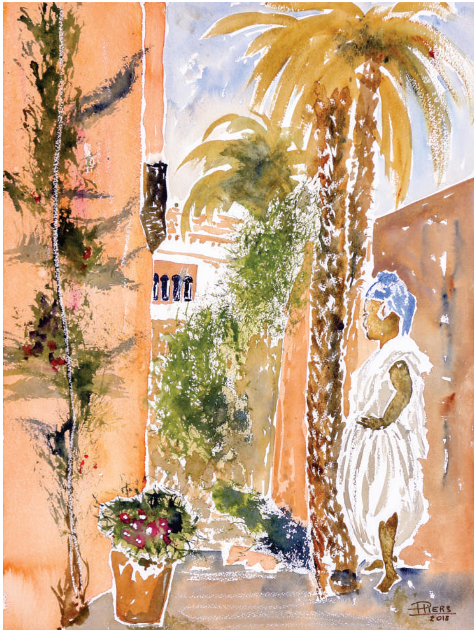
Femme au turban bleu / Woman with blue turban, 2018, aquarelle/watercolour, 61x46 cm