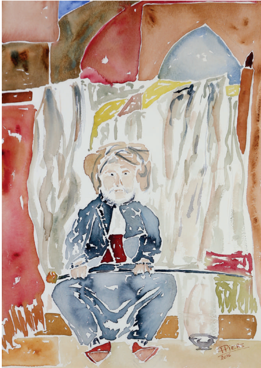
Méditation/ Meditation, 2016, aquarelle/watercolor, 61x46 cm