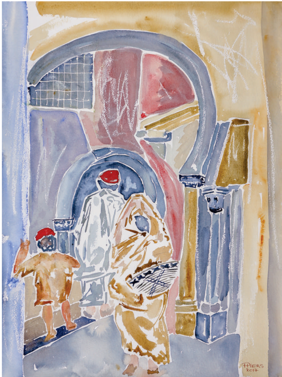
Femme au couffin / Woman with straw basket, 2017, aquarelle/watercolour, 61x46 cm