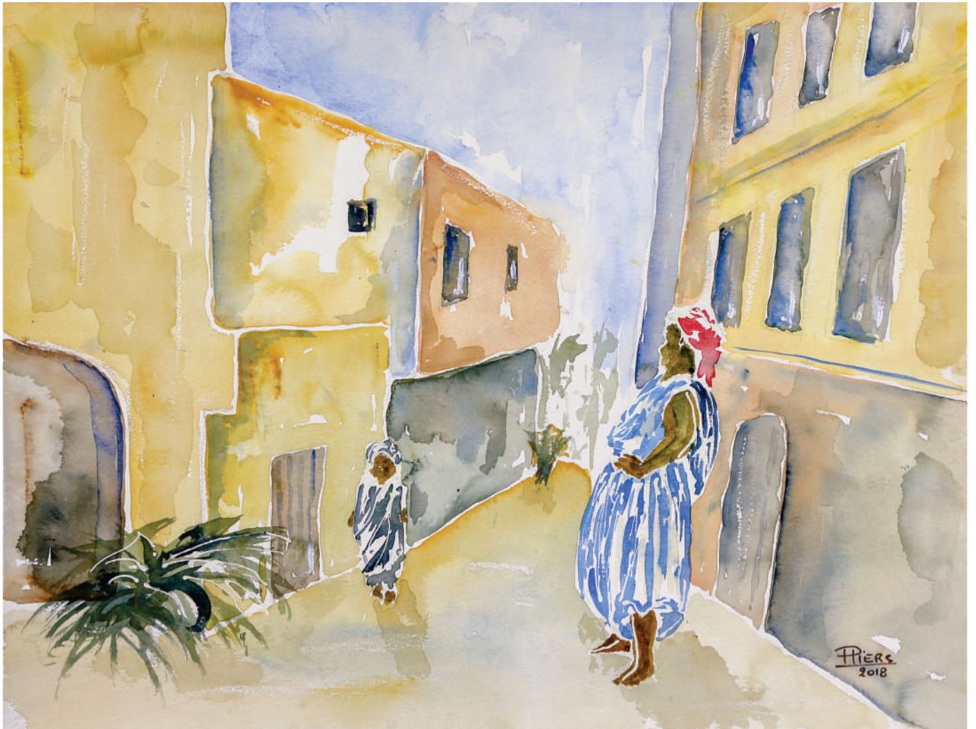
Femme au turban rouge / Woman with red turban, 2018, aquarelle/watercolour, 46x61 cm