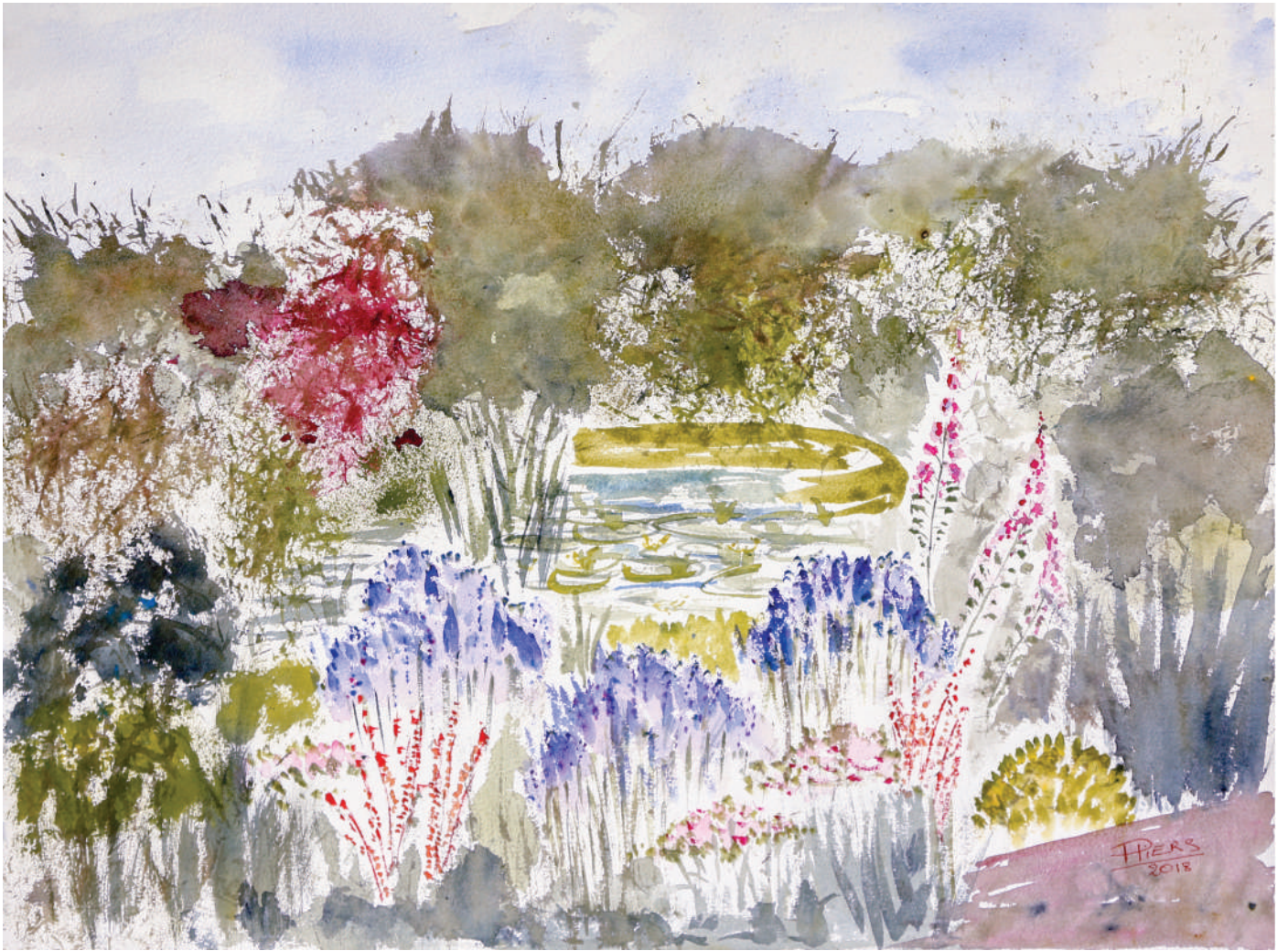
Iris, 2018, aquarelle/watercolour, 46x61 cm