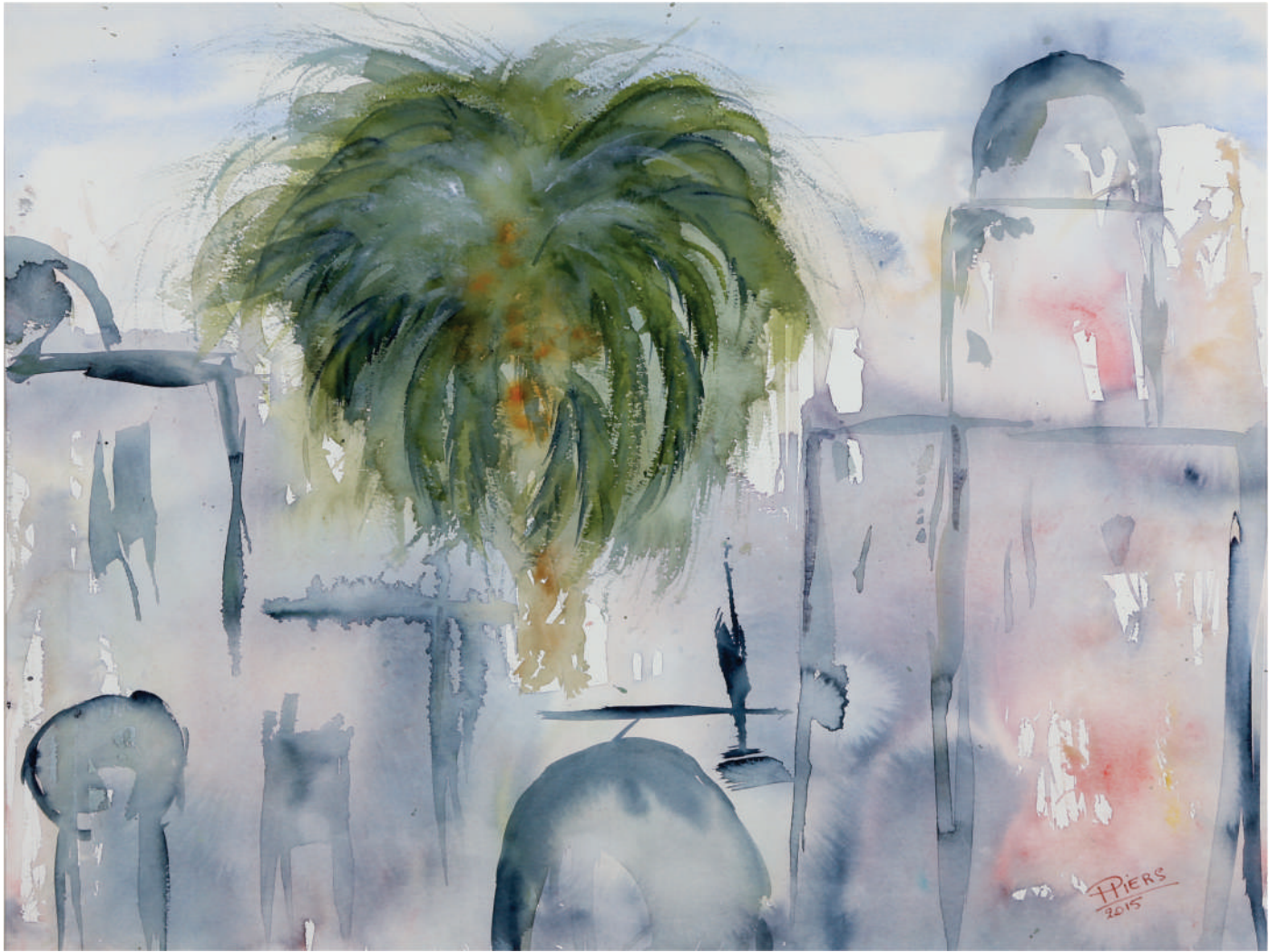
Couples / Domes, 2015, aquarelle/watercolour, 46x61 cm