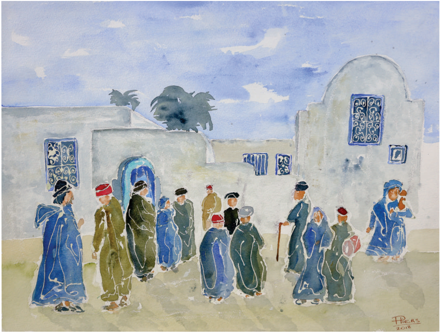
Rencontre / Encounter, 2017, aquarelle/watercolour, 46x61 cm