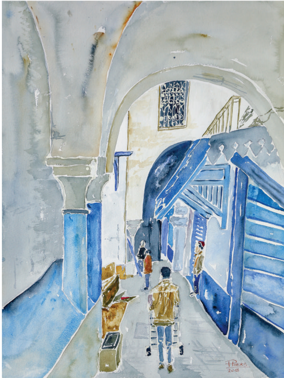
Dans la médina de Tunis / Medina in Tunis, 2018, aquarelle/watercolour, 61x46 cm