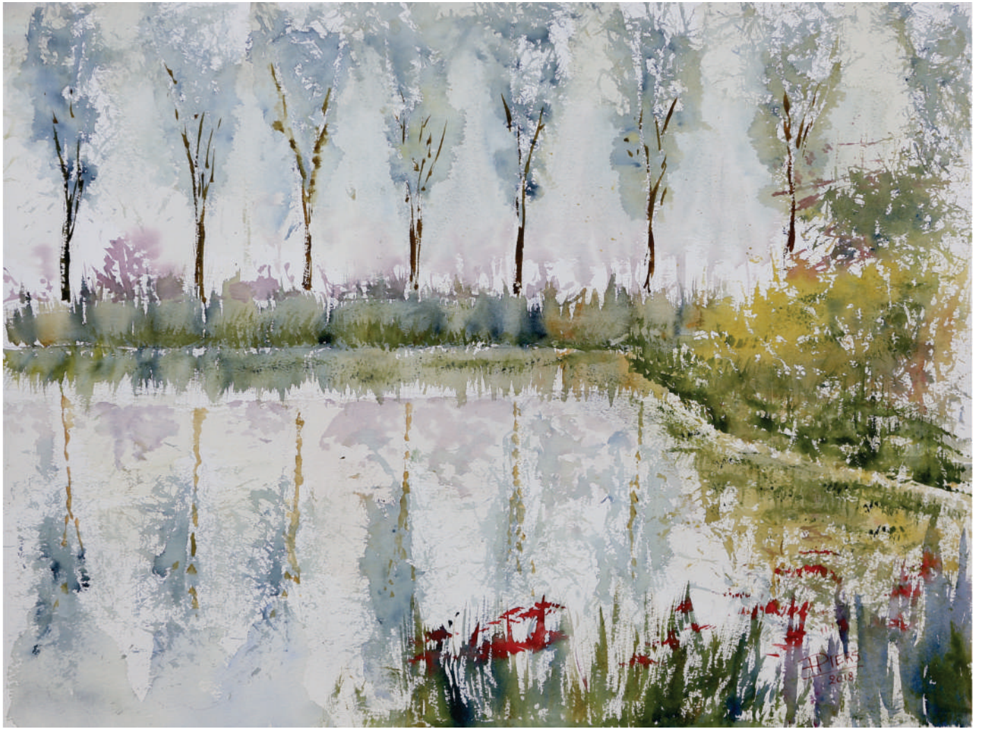
Etang / Pond, 2018, aquarelle/watercolour, 46x61 cm