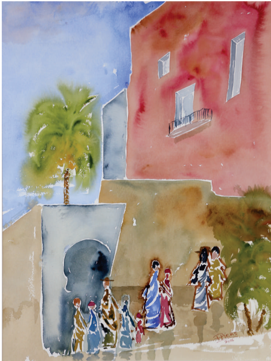
Malte / Malta, 2016, aquarelle/watercolour, 61x46 cm