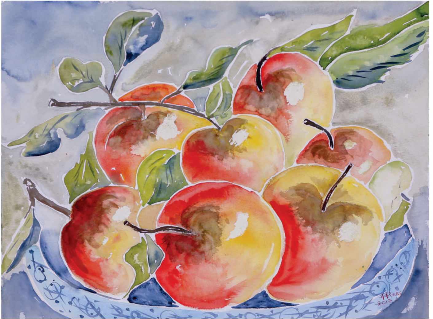
Pommes / Apples, 2017, aquarelle/watercolour, 46x61 cm