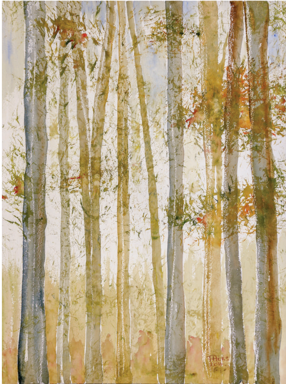
Sous-bois / Undergrowth , 2017, aquarelle/watercolour, 61x46 cm