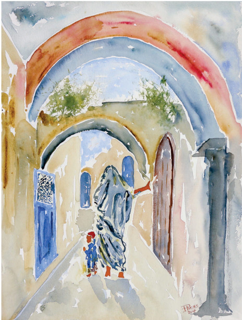
Sous les arcades / Under the arcades, 2017, aquarelle/watercolour, 61x46 cm