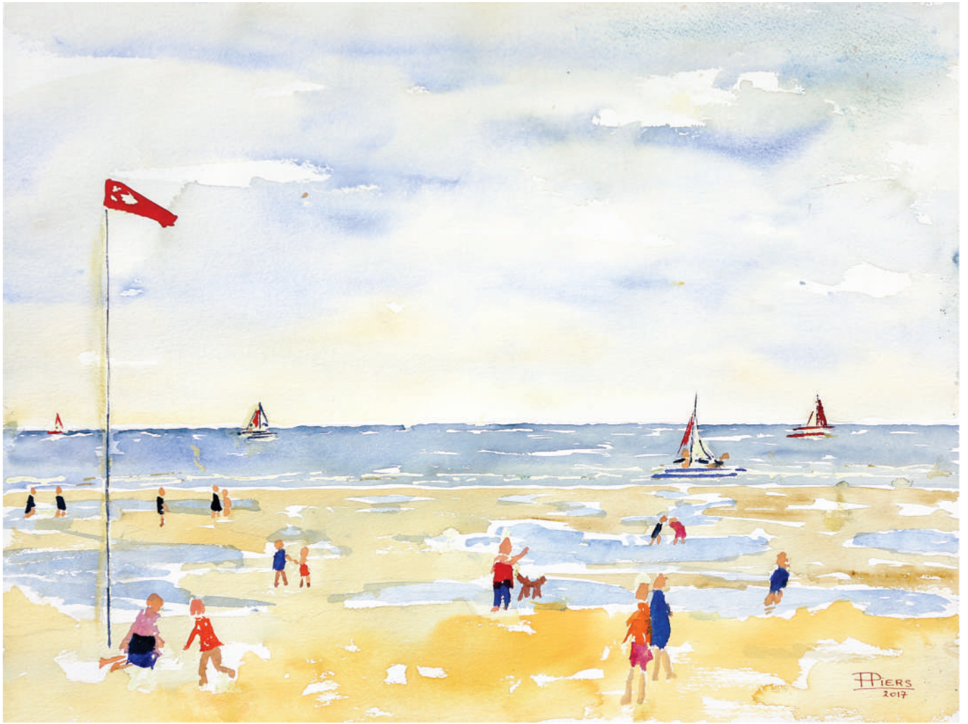
De Haan, plaisirs de plage / De Haan, beach pleasures, 2017, aquarelle/watercolour, 46x61 cm