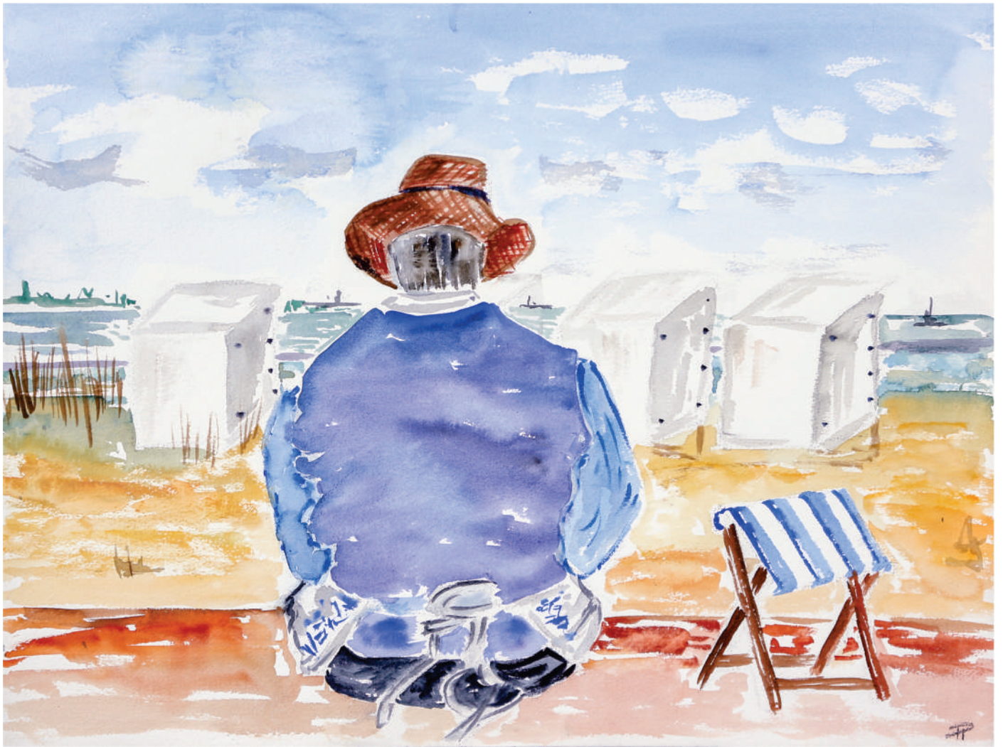
Cadzand Plage / Cadzand Beach, (2012), aquarelle/watercolour, 46x61 cm