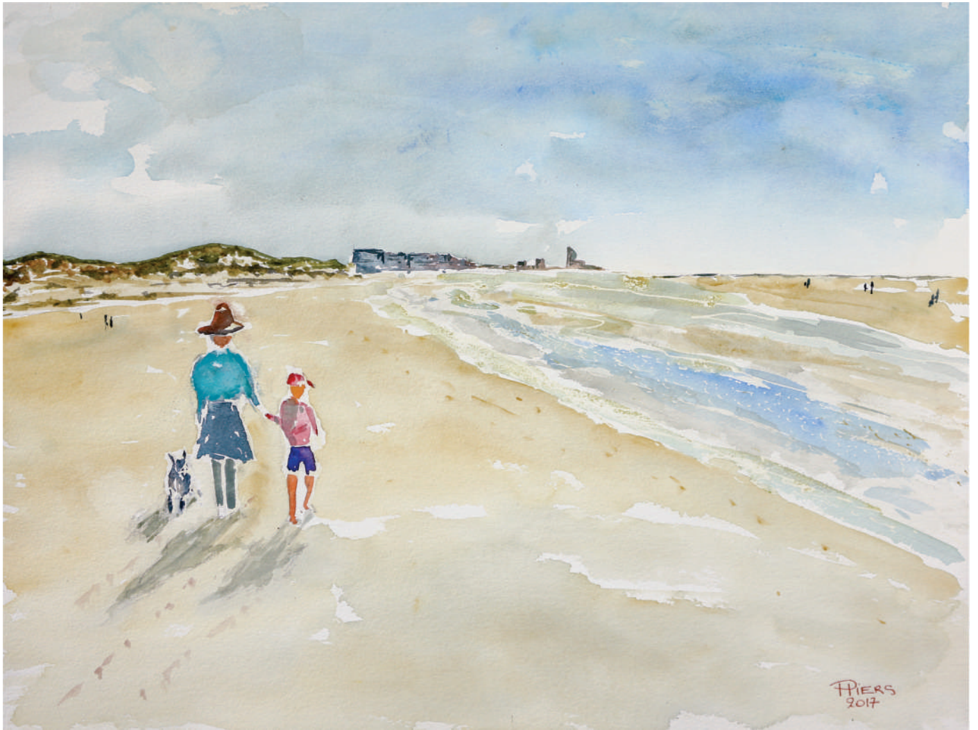
Promenade sur la plage / Walk on the beach, 2017, aquarelle/watercolour, 46x61 cm