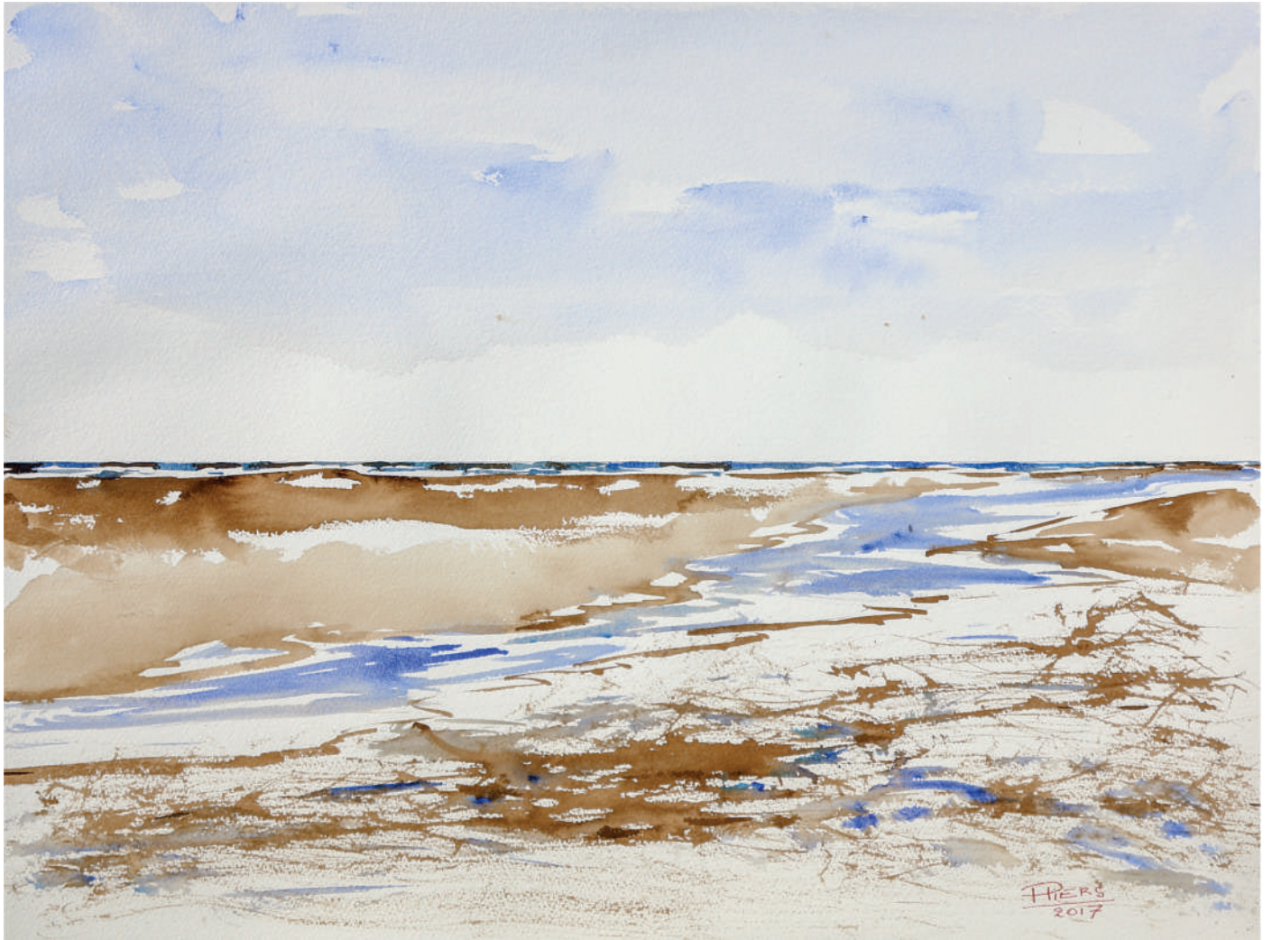
Marine / Beach view, 2017, aquarelle/watercolour, 46x61 cm