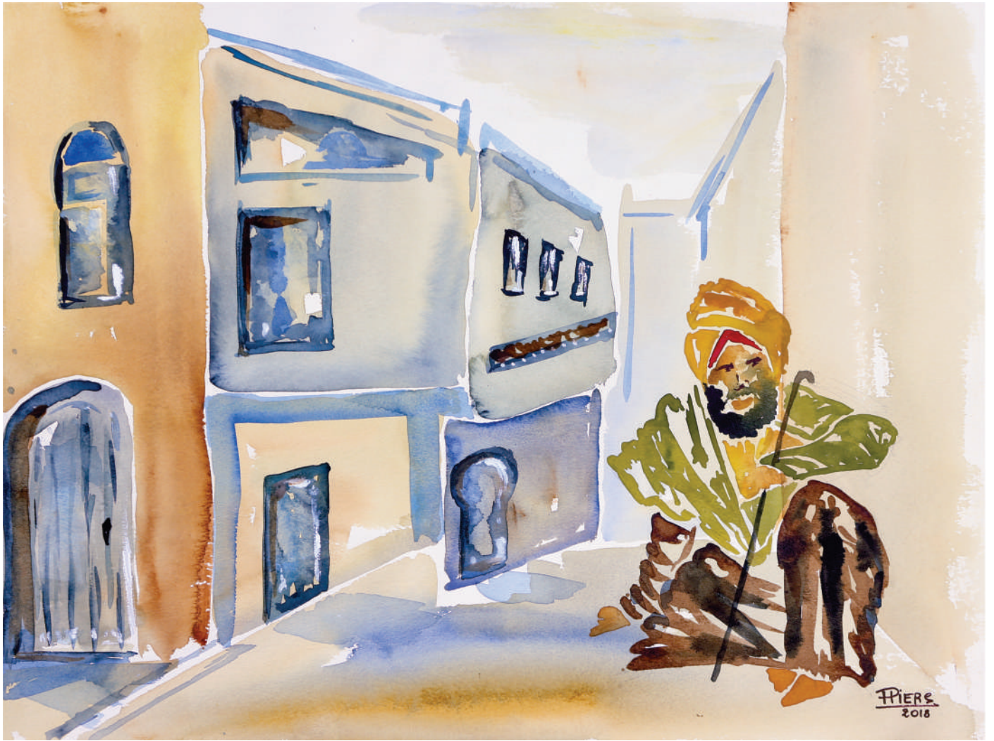
Veillard / Old man, 2018, aquarelle/watercolour, 46x61 cm