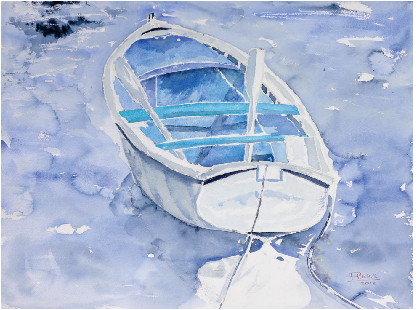
Barquette / Boat, 2018, aquarelle/watercolour, 46x61 cm