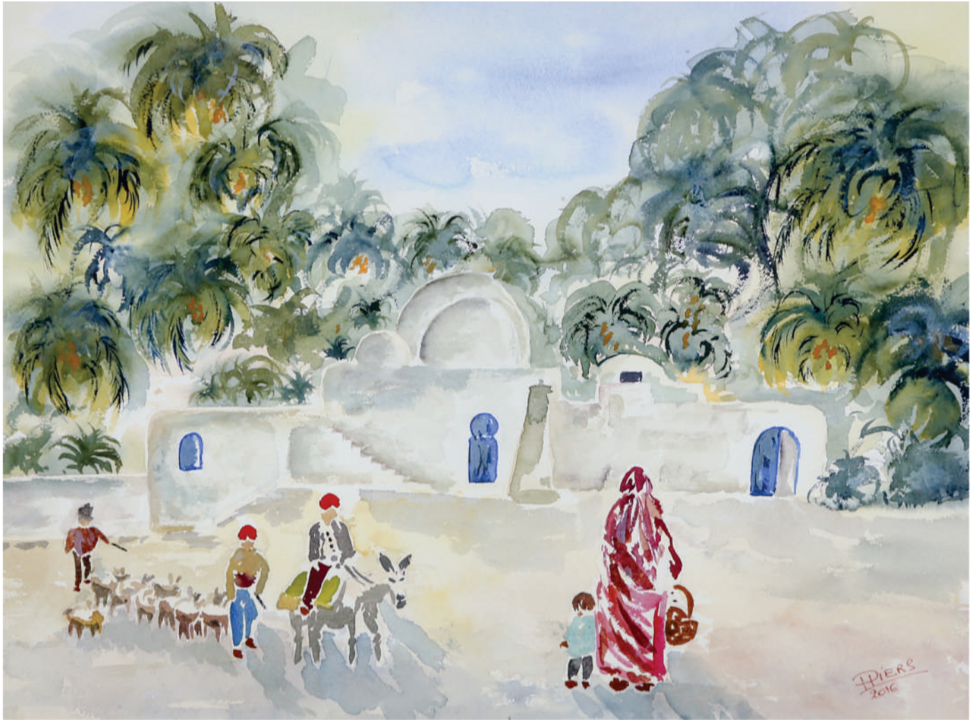
Troupeau / Flock , 2016, aquarelle/watercolour, 46x61 cm