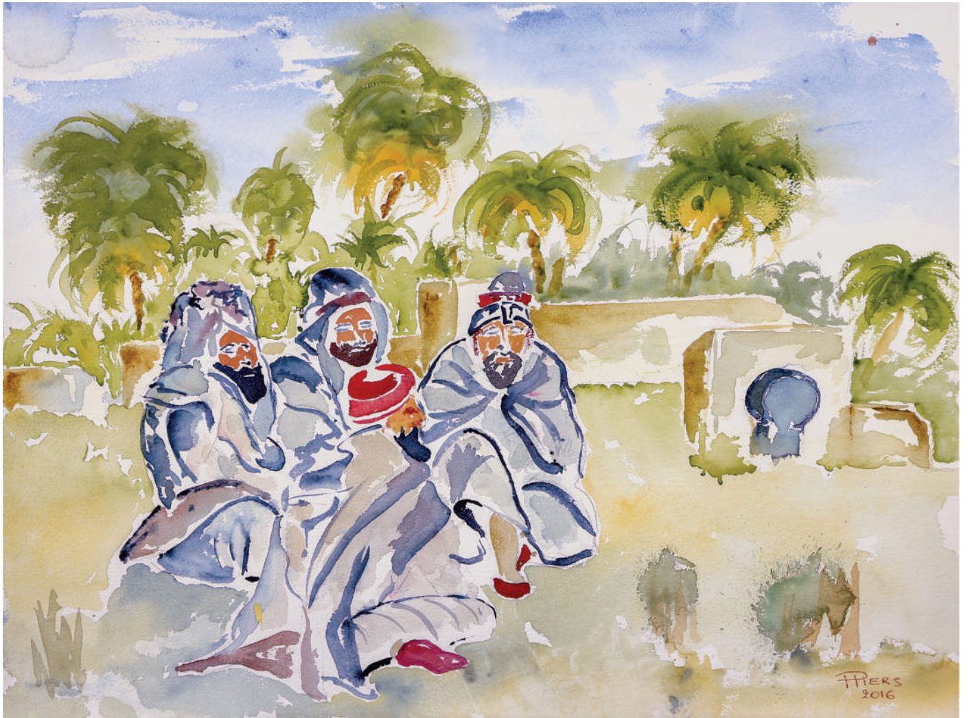
Discussion / discussion, 2016, aquarelle/watercolor, 46x61 cm