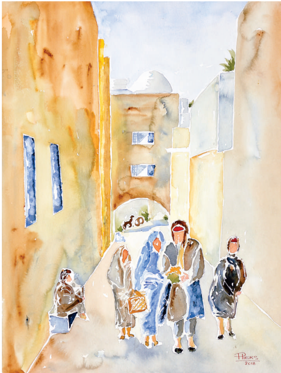
Retour du marché / Back from the market, 2018, aquarelle/watercolour, 61x46 cm