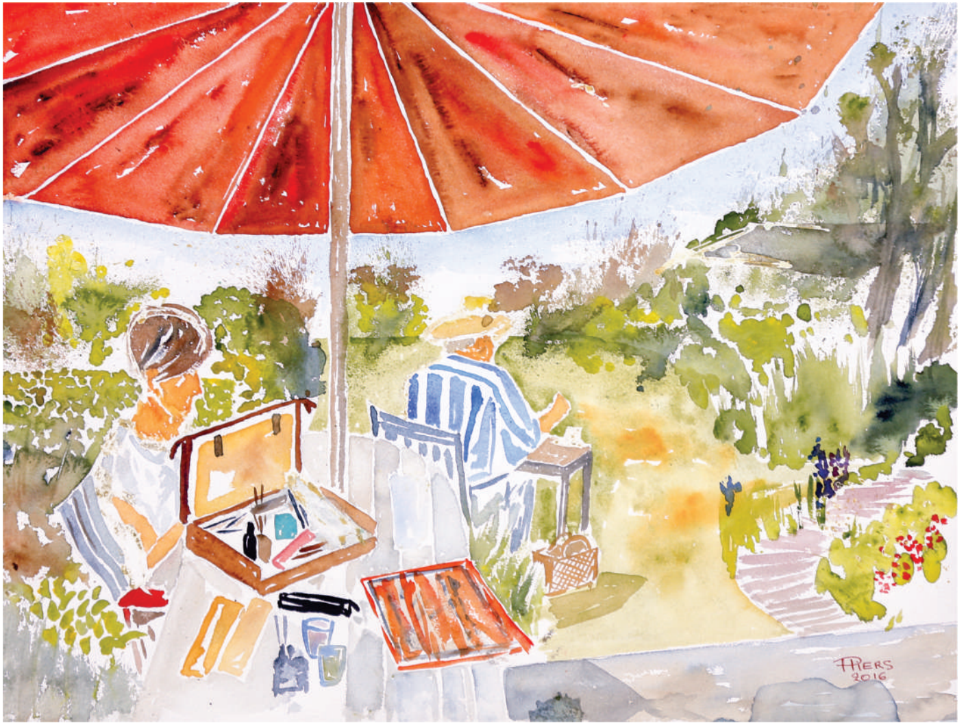
L'artiste au travail / Artist at work, 2018, aquarelle/watercolour, 46x61 cm