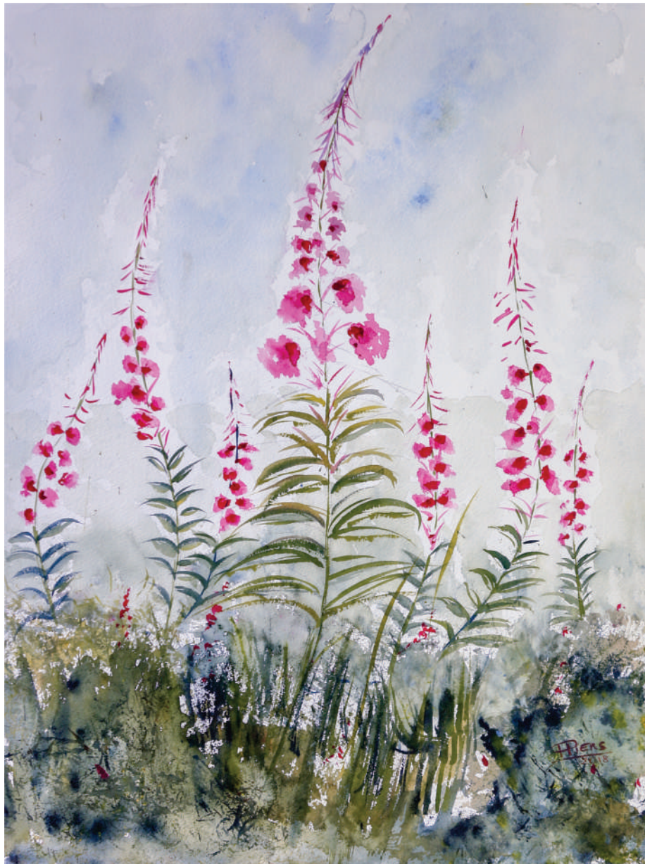
Danse de fleurs / Dance of flowers, 2018, aquarelle/watercolour, 61x46 cm