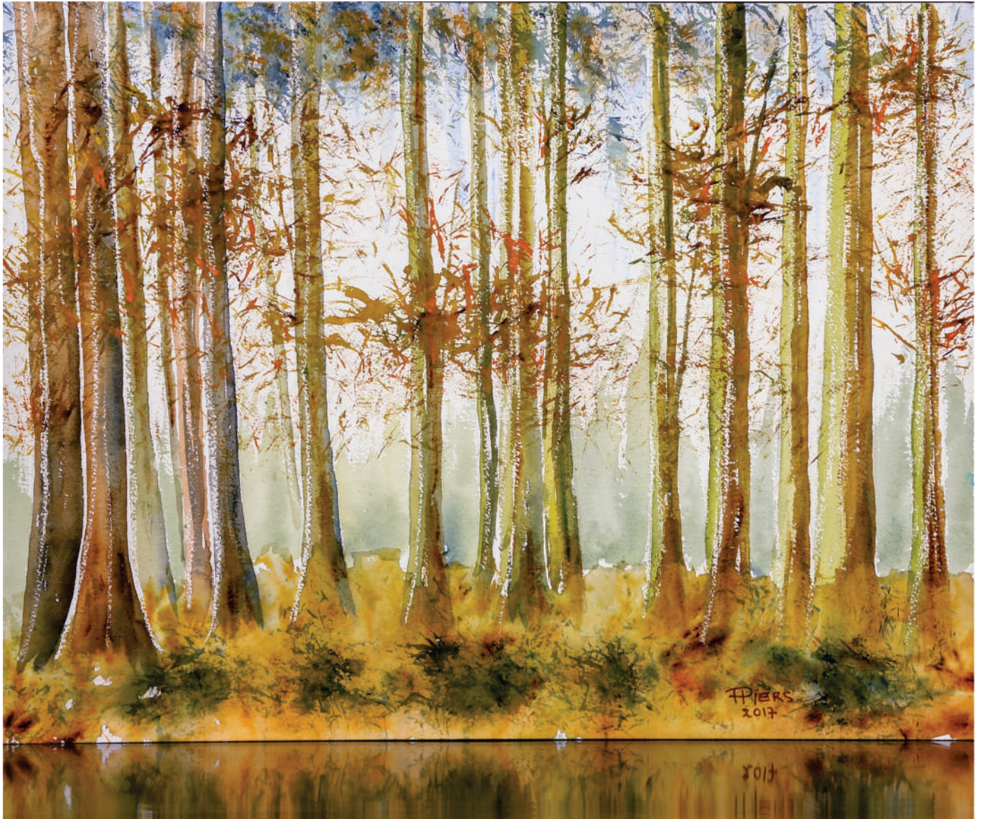
Clairière / Clearing, 2017, aquarelle/watercolour, 46x61 cm