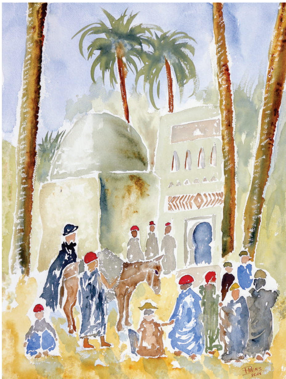
Ane dans la palmeraie / Donkey in the palm grove, 2018, aquarelle/watercolour, 61x46 cm