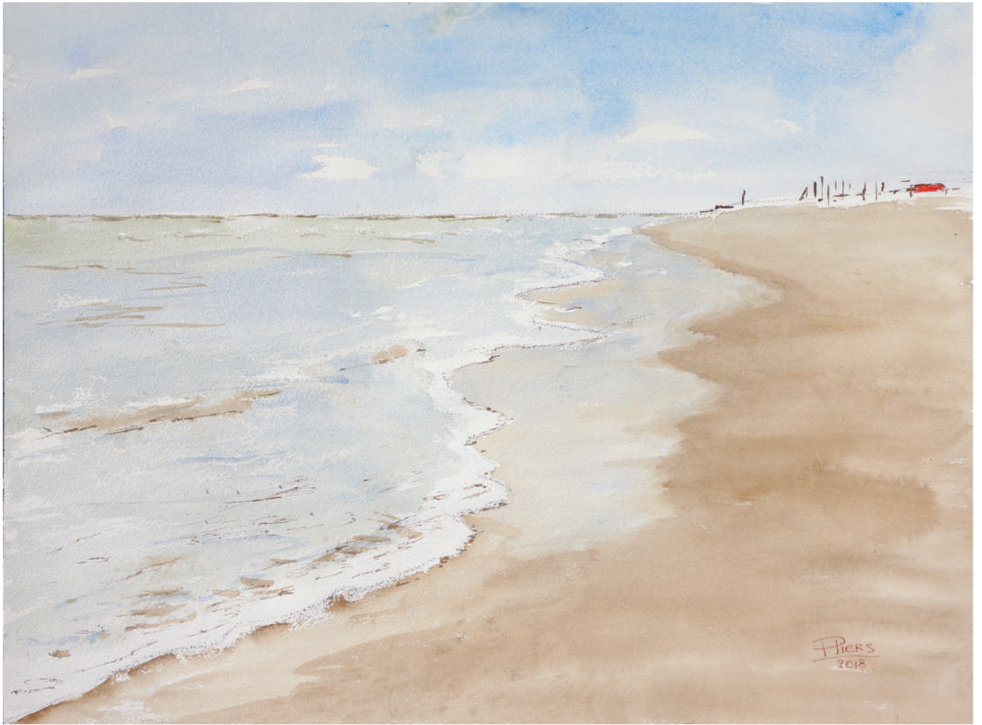
De Haan, plage au calme / De Haan, quiet beach, 2018, aquarelle/watercolour, 46x61 cm