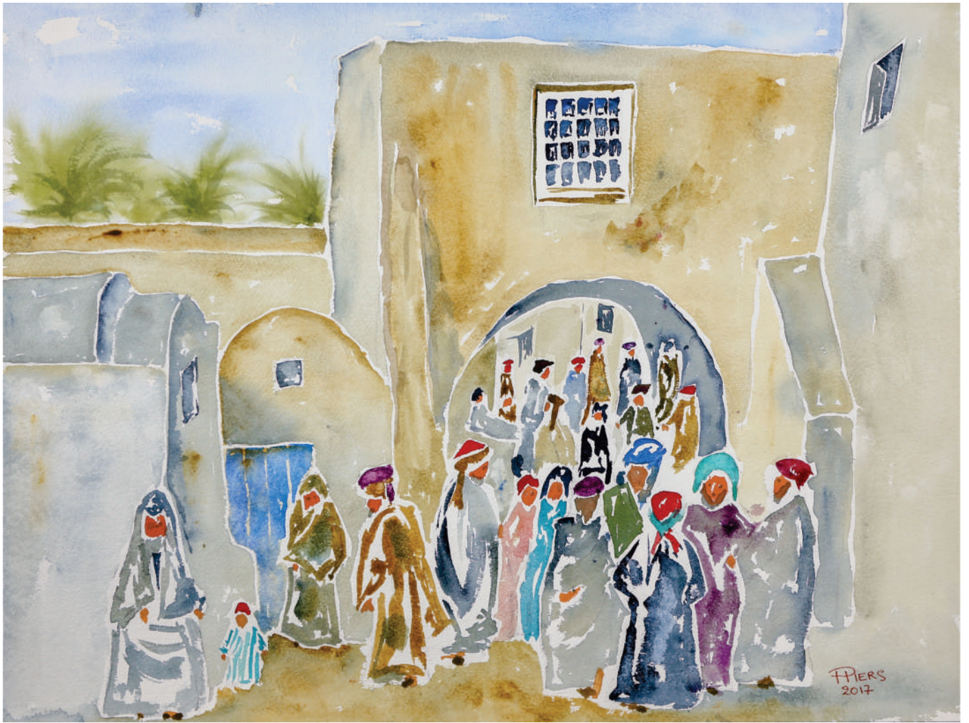
Marché / Market, 2017, aquarelle/watercolour, 46x61 cm