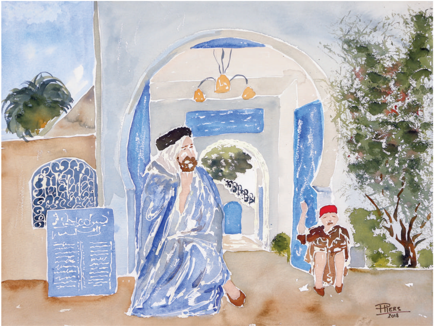
Sage / Wise man, 2018, aquarelle/watercolour, 46x61 cm