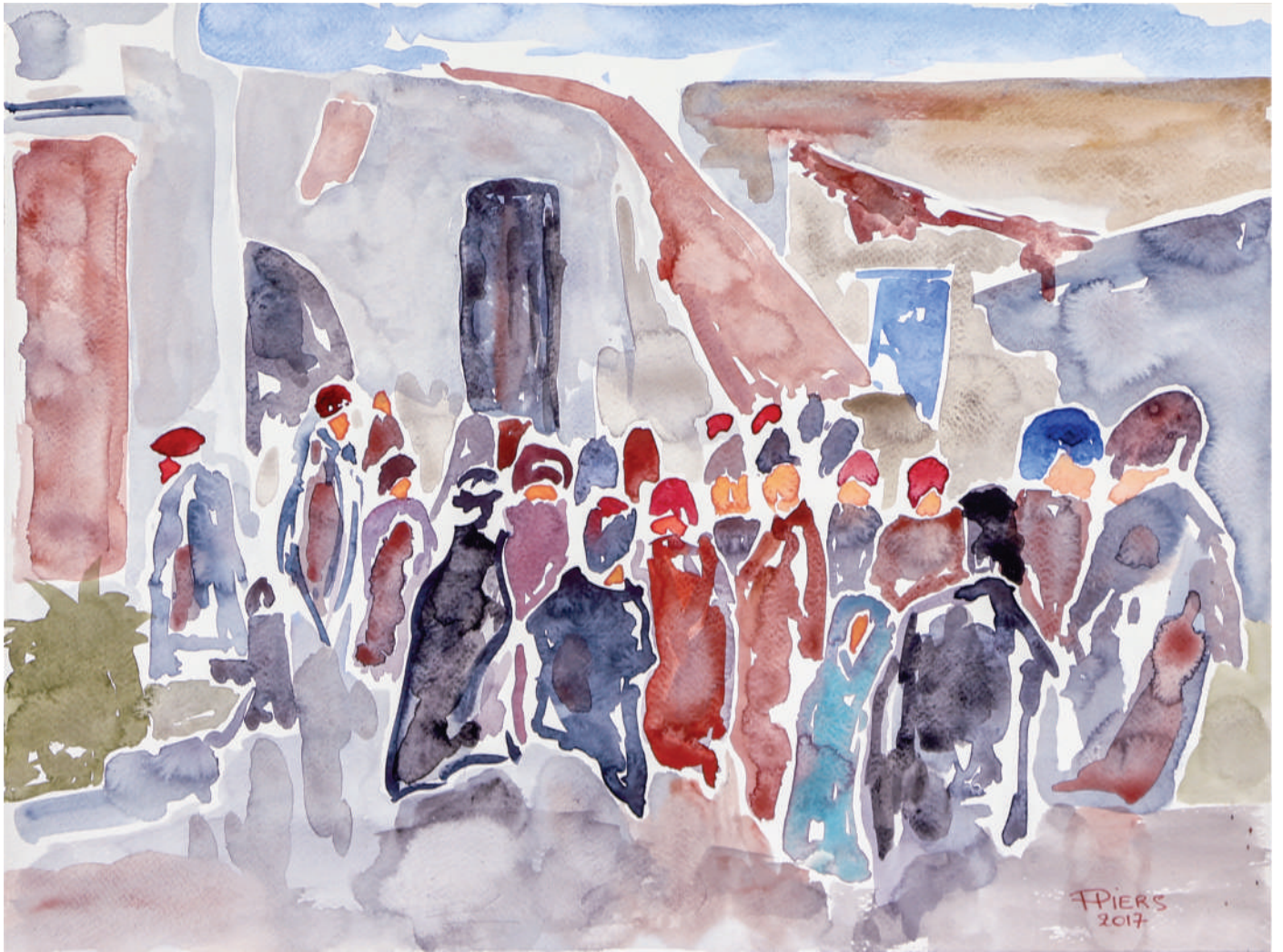
Atroupement / Crowd, 2018, aquarelle/watercolour, 46x61 cm