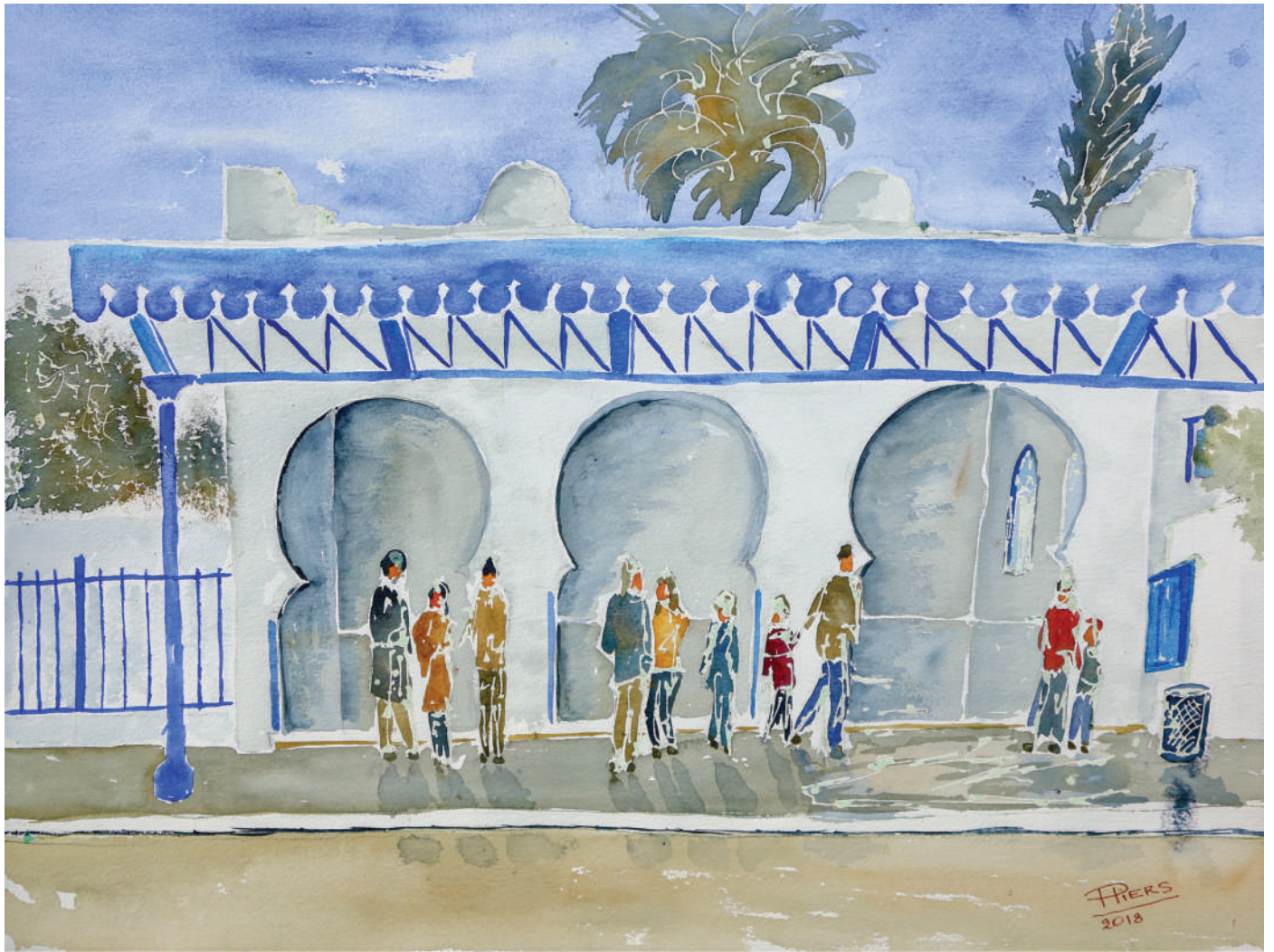
Gare de Sidi Bou Saïd / Station in Sidi Bou Saïd, 2018, aquarelle/watercolour, 46x61 cm