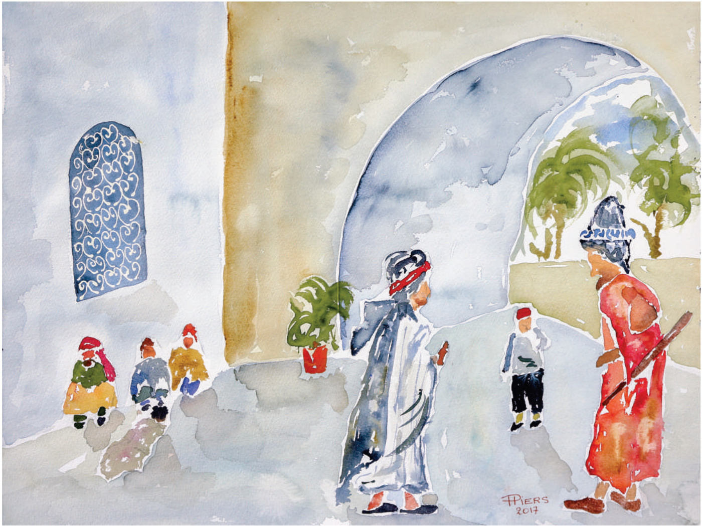
Conseil / Council of wise men, 2016, aquarelle/watercolour, 46x61 cm