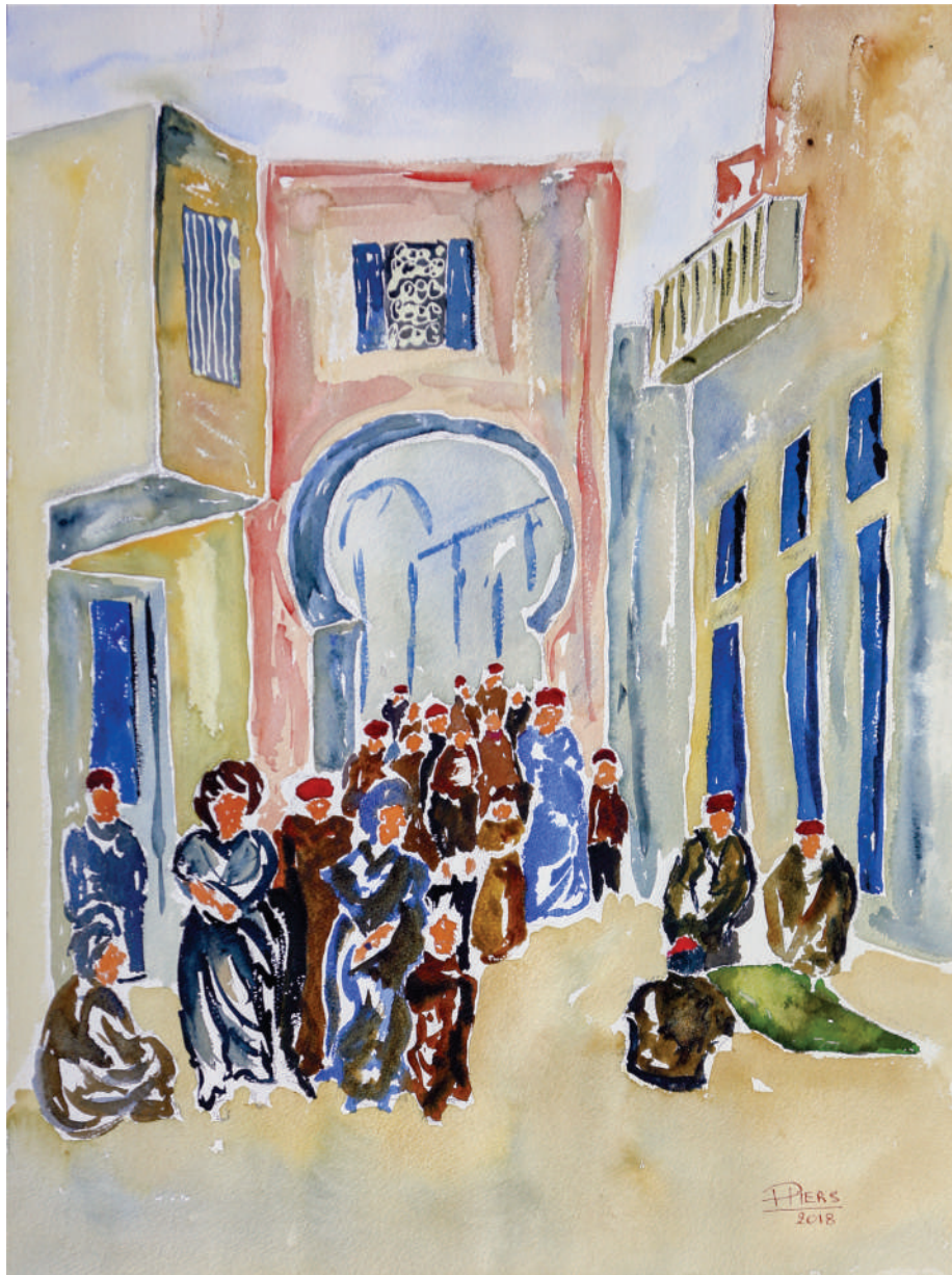
Tapis dans la médina / Carpet in the medina, 2018, aquarelle/watercolour, 61x46 cm